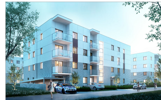
TEDEX RESIDENCE ETAP IV Osiedle przy ul. Nowej 17 w Starej Iwicznej